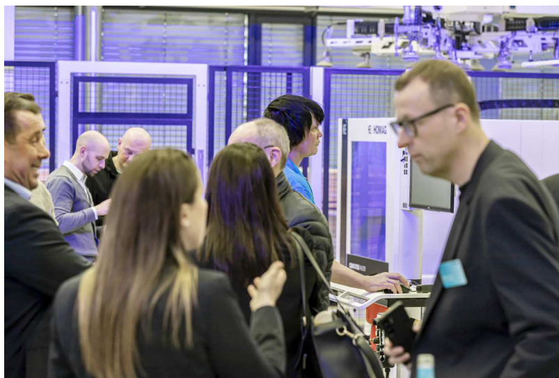
Bild 1 und 2: Impressionen der Technologie-Tage in Holzbronn, Quelle: HOMAG Group AG