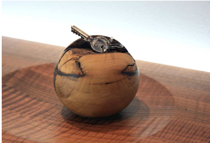
Gesellenstück von Marc Wahl, Detail