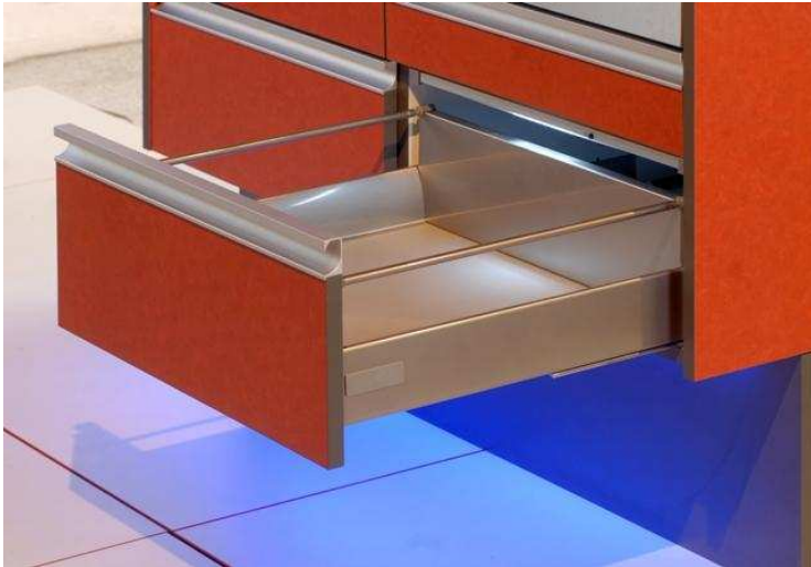
Küche RaumWandel, beleuchtete Schubladen